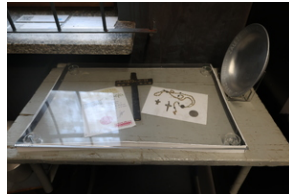
Zwiedzanie Muzeum Jana Pawła II oraz wystawy „A jutro jest nieznane. Podziemna Solidarność w Stalowej Woli 1982-1989”.