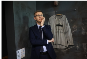
Zwiedzanie Muzeum Jana Pawła II oraz wystawy „A jutro jest nieznane. Podziemna Solidarność w Stalowej Woli 1982-1989”.