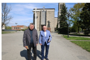
Zwiedzanie Muzeum Jana Pawła II oraz wystawy „A jutro jest nieznane. Podziemna Solidarność w Stalowej Woli 1982-1989”.

Organizatorzy: Ogólnopolskie Stowarzyszenie Internowanych w Obozach Wojskowych w latach 1982-1984, Instytut Pamięci Narodowej Oddział w Rzeszowie i Fundacja Uniwersytecka w Stalowej Woli.