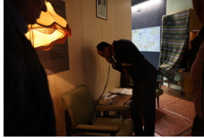
Zwiedzanie Muzeum Jana Pawła II oraz wystawy „A jutro jest nieznane. Podziemna Solidarność w Stalowej Woli 1982-1989”.