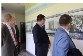
Zwiedzanie Muzeum Jana Pawła II oraz wystawy „A jutro jest nieznane. Podziemna Solidarność w Stalowej Woli 1982-1989”.