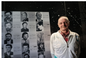
Zwiedzanie Muzeum Jana Pawła II oraz wystawy „A jutro jest nieznane. Podziemna Solidarność w Stalowej