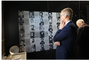
Zwiedzanie Muzeum Jana Pawła II oraz wystawy „A jutro jest nieznane. Podziemna Solidarność w Stalowej Woli 1982-1989”.