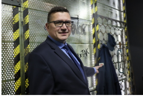
Zwiedzanie Muzeum Jana Pawła II oraz wystawy „A jutro jest nieznane. Podziemna Solidarność w Stalowej Woli 1982-1989”.