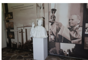
Zwiedzanie Muzeum Jana Pawła II oraz wystawy „A jutro jest nieznane. Podziemna Solidarność w Stalowej Woli 1982-1989”.