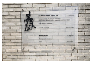
Zwiedzanie Muzeum Jana Pawła II oraz wystawy „A jutro jest nieznane. Podziemna Solidarność w Stalowej Woli 1982-1989”.