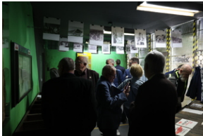
Zwiedzanie Muzeum Jana Pawła II oraz wystawy „A jutro jest nieznane. Podziemna Solidarność w Stalowej Woli 1982-1989”.