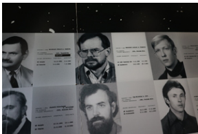
Zwiedzanie Muzeum Jana Pawła II oraz wystawy „A jutro jest nieznane. Podziemna Solidarność w Stalowej Woli 1982-1989”.