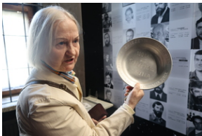
Zwiedzanie Muzeum Jana Pawła II oraz wystawy „A jutro jest nieznane. Podziemna Solidarność w Stalowej