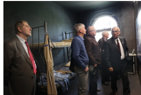
Zwiedzanie Muzeum Jana Pawła II oraz wystawy „A jutro jest nieznane. Podziemna Solidarność w Stalowej Woli 1982-1989”.