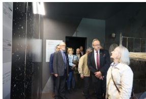
Zwiedzanie Muzeum Jana Pawła II oraz wystawy „A jutro jest nieznane. Podziemna Solidarność w Stalowej Woli 1982-1989”.