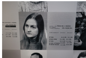
Zwiedzanie Muzeum Jana Pawła II oraz wystawy „A jutro jest nieznane. Podziemna Solidarność w Stalowej