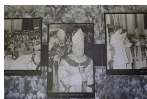
Zwiedzanie Muzeum Jana Pawła II oraz wystawy „A jutro jest nieznane. Podziemna Solidarność w Stalowej Woli 1982-1989”.