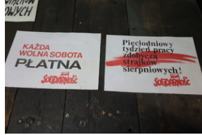
Zwiedzanie Muzeum Jana Pawła II oraz wystawy „A jutro jest nieznane. Podziemna Solidarność w Stalowej Woli 1982-1989”.