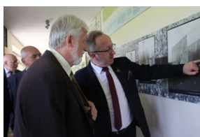
Zwiedzanie Muzeum Jana Pawła II oraz wystawy „A jutro jest nieznane. Podziemna Solidarność w Stalowej Woli 1982-1989”.